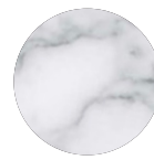
marmo bianco di Carrara

Materiali: marmo bianco di Carrara, alluminio.