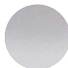
acciaio inox 316